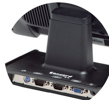
Peana exclusiva con conectores extras