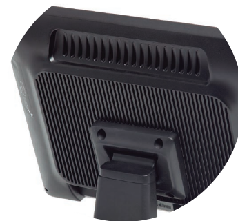
Chasis de aluminio

TPV Concord 404, fuente de alimentación con CA EUR y CD-Rom Drivers